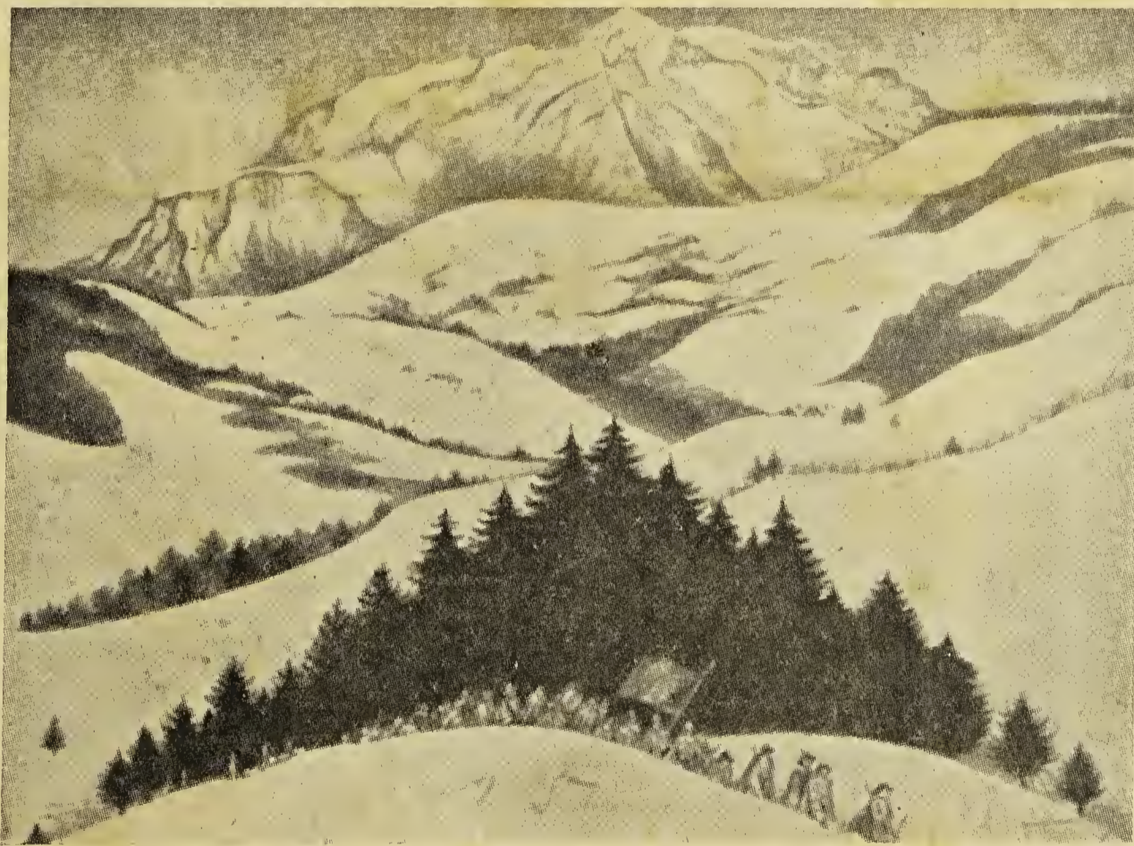
Los del "Glorioso Regreso" cruzando Saboya, cerca del monte Mégève Agosto 1689

Los Valdenses Desterrados.—Fiesta Patria... — Del Pastor Silvio Long.—Himnología.—Problemas de nuestra Iglesia.—Nuestros Niños.—Crecer.—El Evangelio de Jesucristo.—El Correo.—La calzada preferida.—La lectura de la Biblia.—El Credo de un verdadero cristiano.—El Espíritu de Verdad.—Asociación Evangélica Metodista de Laicos.—Bos Valdenses.—Nacimientos.—Bautismos.—Enlaces.—In Memoriam.